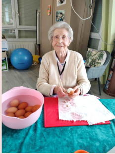
Atelier cuisine « repas comme à la maison »