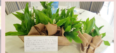
Remerciements au château de Beaussais pour leur don de muguet