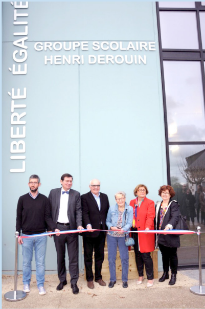
Cérémonie du 8 mai Trégon-Ploubalay